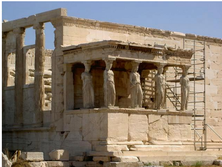
Lámina 2 (hasta 4 puntos). / Lámina 2 (ata 4 puntos).

Señala sus características formales (hasta 1 punto). / Sinala as súas características formais (ata 1 punto).