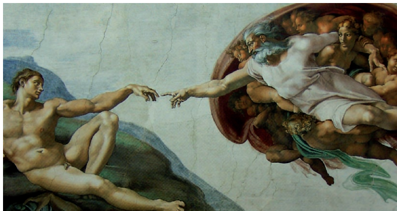
Lámina 2 (hasta 4 puntos). / Lámina 2 (ata 4 puntos).

Estúdiala iconográfica y formalmente hasta 2 puntos). / Estuda iconográfica e formalmente esta obra (ata 2 puntos).