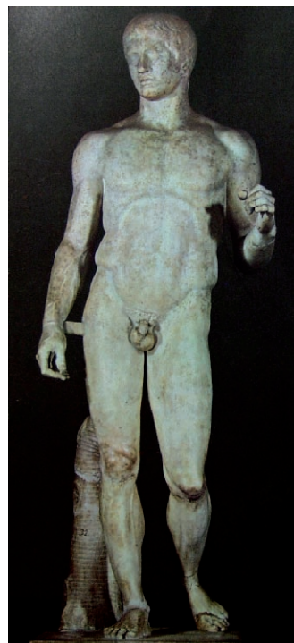
Lámina 2 (hasta 4 puntos). / Lámina 2 (ata 4 puntos).

Realiza un estudio formal de la obra incidiendo en el análisis de su canon (hasta 2 puntos). / Realiza un estudio formal da obra incidindo na análise do seu canon (ata 2 puntos).