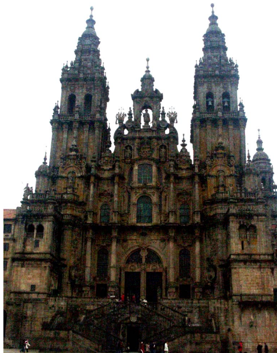
Lámina 2 (hasta 4 puntos) / Lámina 2 (ata 4 puntos)

Analiza tipológicamente y señala las características formales de esta obra (hasta 1 punto). / (hasta 1 punto). / Analiza tipoloxicamente e sinala as características formais desta obra (ata 1 punto).